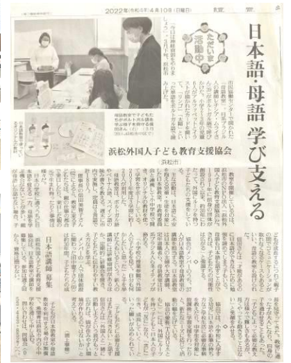
4月10日 読売新聞に掲載されました。